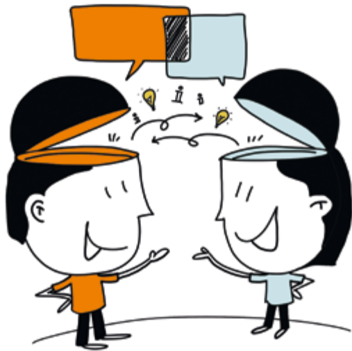
18. Debat en dialoog