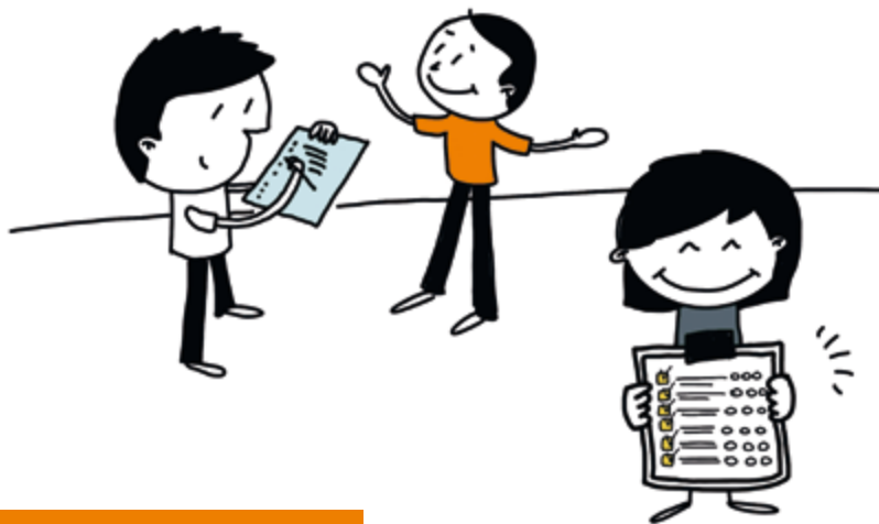
1. Behoeften en verhalen