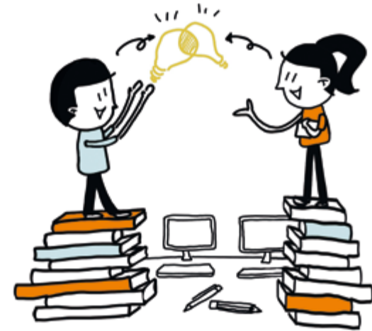
7. Leer- en werkplekken