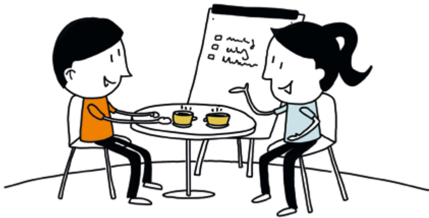
5. Training en coaching