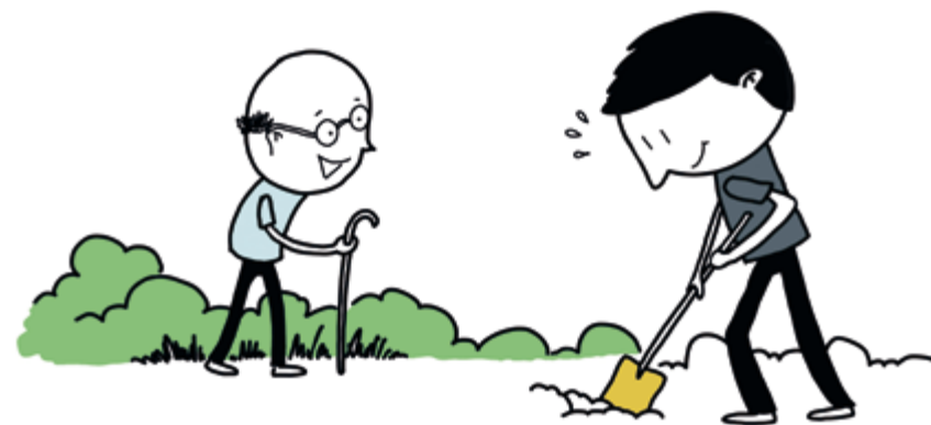
4. Burenhulp en praktische hulpdienst