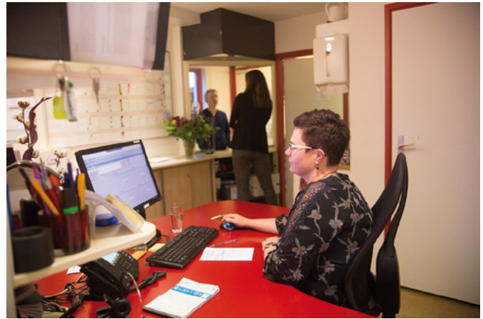
Tijd voor patiënten in Huisartsenpraktijk Afferden.